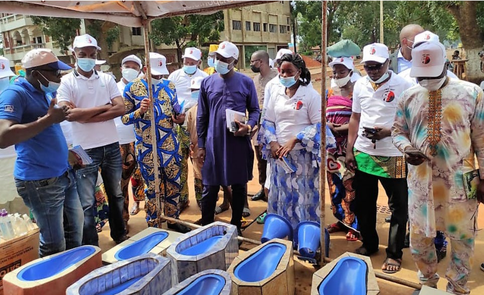
UN ENTREPRENEUR D'ASSAINISSEMENT PRESENTE SES TOILETTES PREFABRIQUEES LORS DE LA IMT 2021 AU BENIN