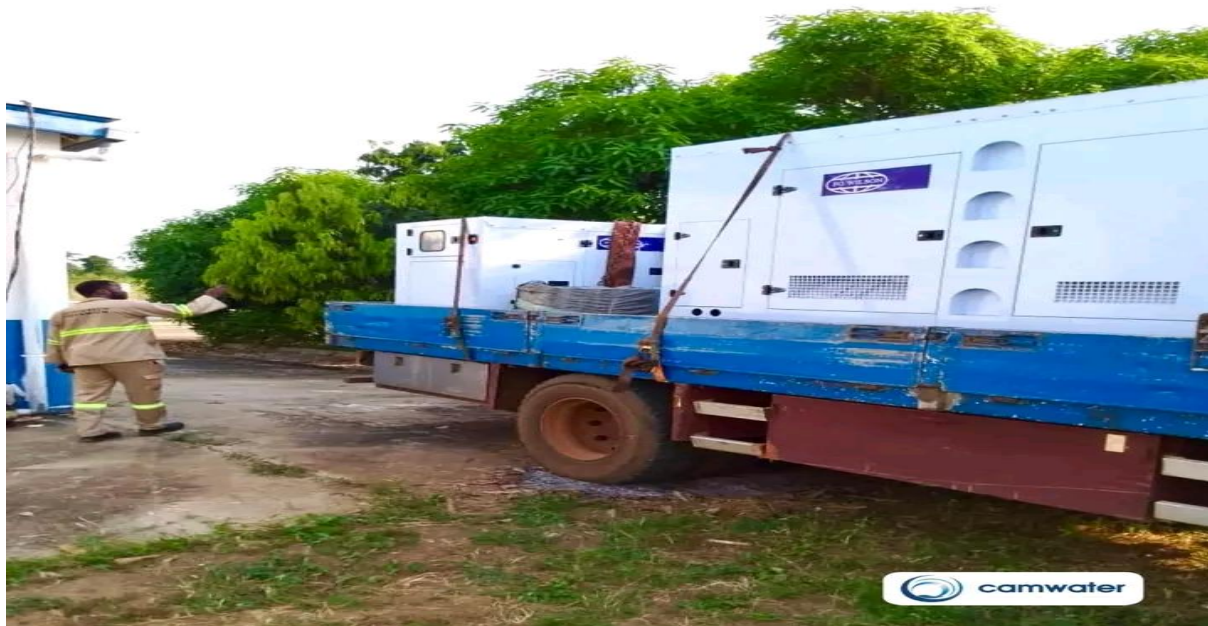
Figure 3 : Installation du Groupe Electrogène

Ce générateur fait partie d'un important stock d'équipements acquis récemment et déployés dans plusieurs autres usines, notamment à Eséka, Makak et Mfou.