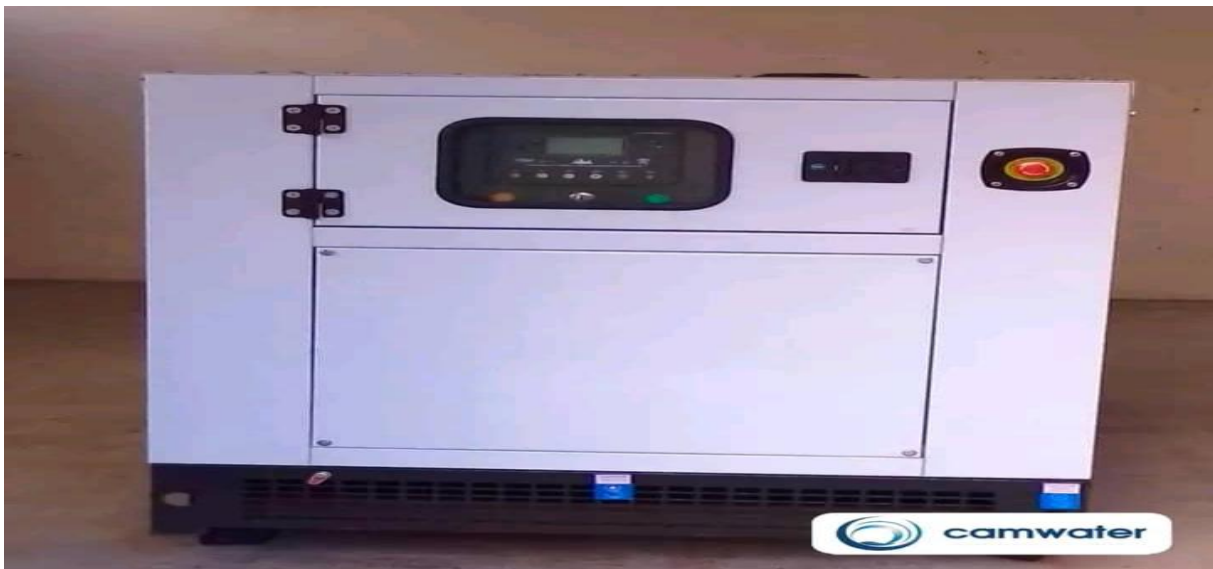
Figure 2 : acquisition du Groupe Electrogène

De nombreux efforts de la CAMWATER-Délégation Régionale du Centre (DRC), avec l'installation du groupe électrogène de 75 KVA à l'usine de Monatéle le mercredi 11 décembre 2024,