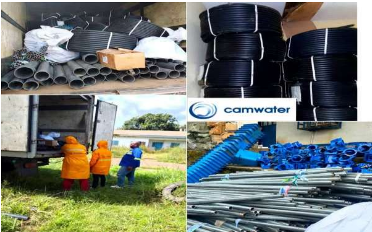
Figure 2 : Matériels de branchements aux réseaux de distribution d'eau de la CAMWATER

NKODABEL est un village situé à 5 KM au sud de l'arrondissement d'Evoudoula, département de Lekie, région Centre, Cameroun.