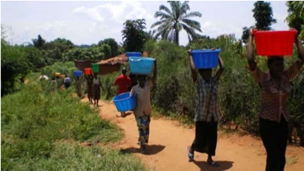
Figure 3 : Population de NKODABEL sortante du point d'adduction d'eau potable

branchement en instance des populations de l'Arrondissement d'Evodoula et ses environs pour faciliter l'accès à l'eau potable et aux services d'assainissement.